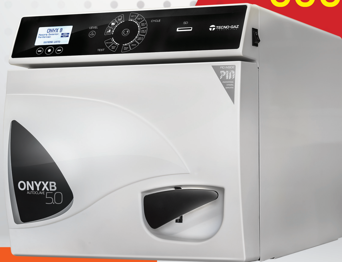
AUTOCLAVE ONYX 5.0 - 17L TECNOGAZ